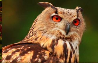
BUFO REAL (BUFO BUFO)

A metade noroeste do concello de Covelo caracterízase polos abruptos desniveis creados polo río Alén no seu discorrir entre a Serra do Suído e o Coto de Eiras. Este río que forma parte da Rede Natura 2000, a rede europea de espazos naturais protexidos, drena as caixas e planaltos destas dúas serras para aportar as súas augas o río Tea, formando no seu conxunto unha das redes fluviais mellor conservadas do sur de Galicia en canto a calidade das súas augas, os seus habitats de ribeira, e especies animais e vexetais.