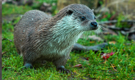
LOUTRA (LUTRA LUTRA)

A fauna da zona, á lóxica presenza de especies do medio acuático como o migrador ameán ou reo ( Salmo trutta trutta ) que mesmo posúe un topónimo propio no río Alén: a "poza dos ameáns", ou a lontra ( Lutra lutra ). Engade a posibilidade de desfrutar coa experiencia única de sentir o canto á noite do bufo real ( Bubo bubo ) nas abruptas e fraguentas penedias das Costas do Alén.