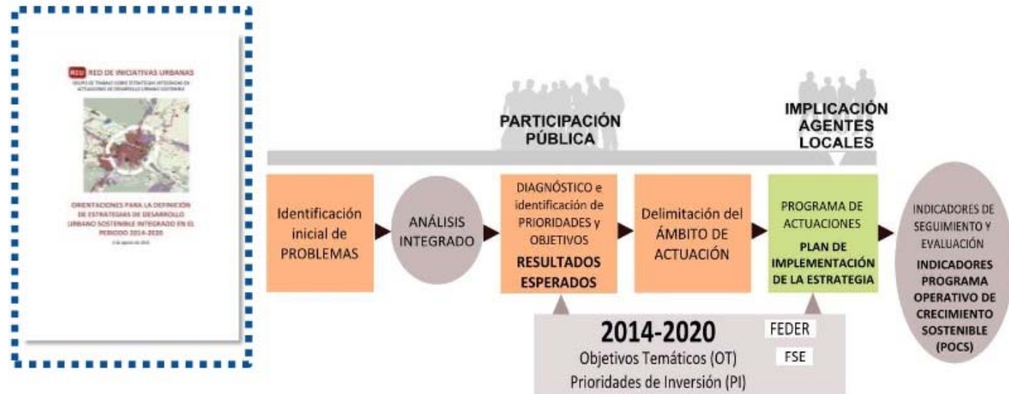
Diagrama orientativo de desarrollo de la estrategia de desarrollo urbano sostenible integrado

Orientaciones para la Definición de Estrategias de Desarrollo Urbano Sostenible Integrado en el periodo 2014-2020 (Red de Iniciativas Urbanas, 2015)